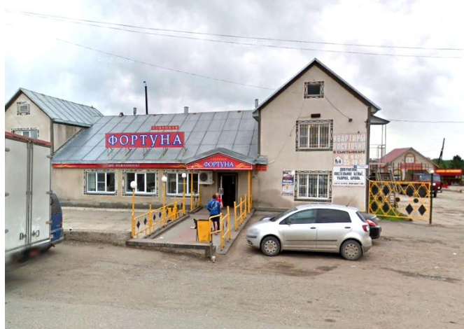
КП3 Даниловка/Столовая Фортуна