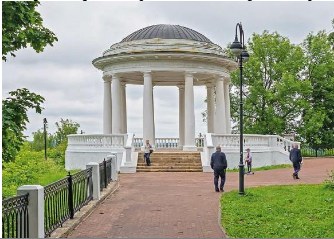
Старт – Береговая ротонда, Наб. Грина, Киров