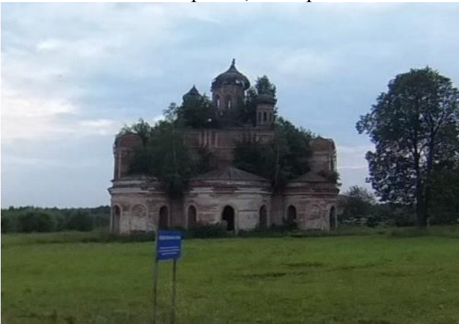
КП2 – церковь, с. Кырмыж