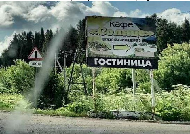
КП4 – баннер кафе «Солнце», Кумёны