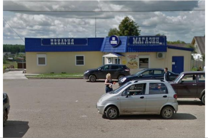
КП1 – пекарня, с. Кстинино