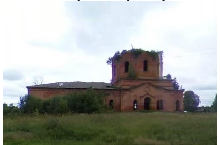
КП3 – церковь, с. Верхобыстрица