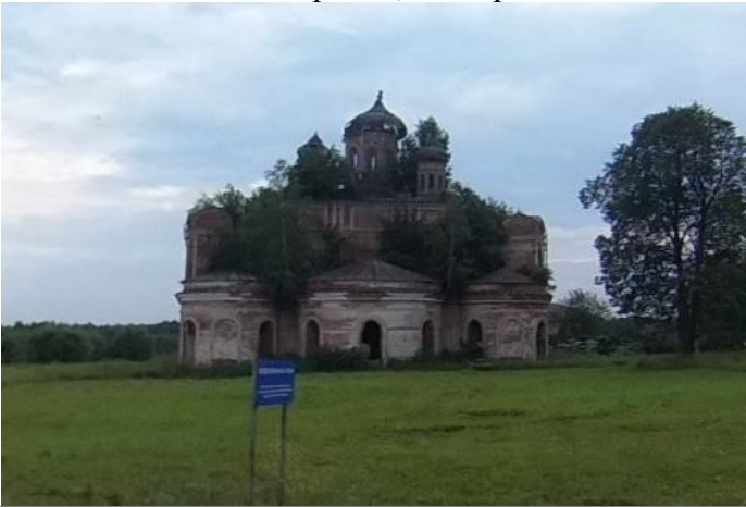
КП2 – церковь, с. Кырмыж