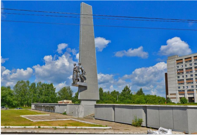
Старт – стела, Кирово-Чепецк