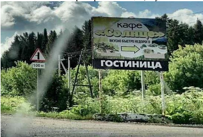
КП4 – баннер кафе «Солнце», Кумёны