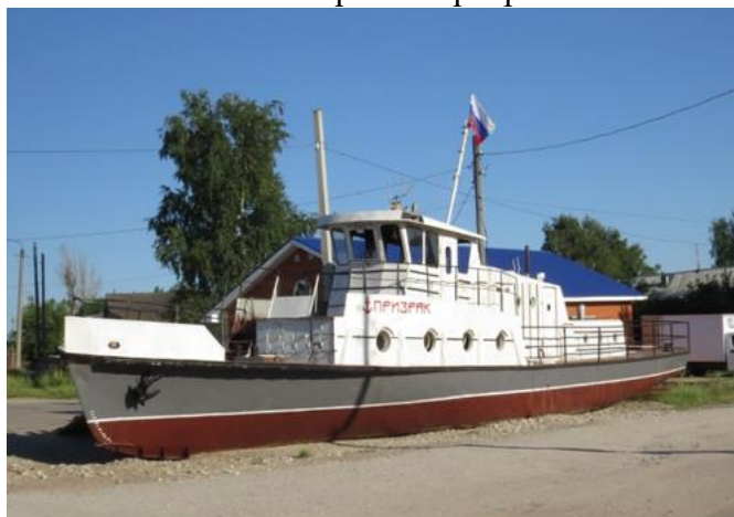
КП3 – Корабль Призрак