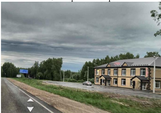
КП5 – кафе/отель «Троя»