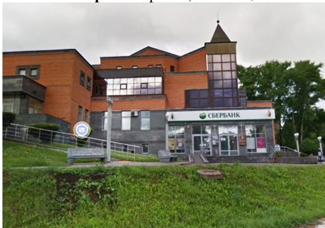
Старт - Сбербанк, К-Чепецк