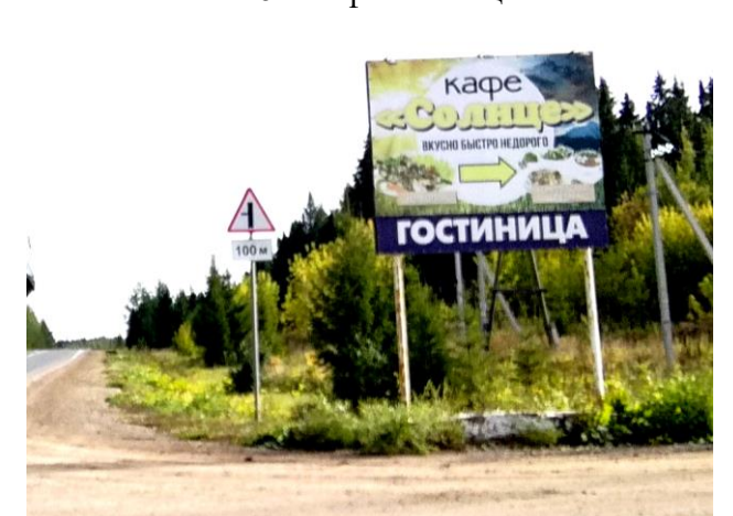
КП6 – кафе «Солнце»