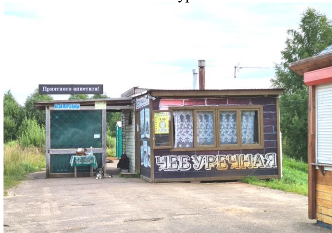
КП1 – Чебуречная