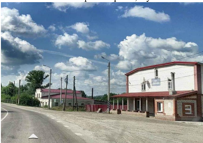
КП2 – кафе «Мираж», Суна