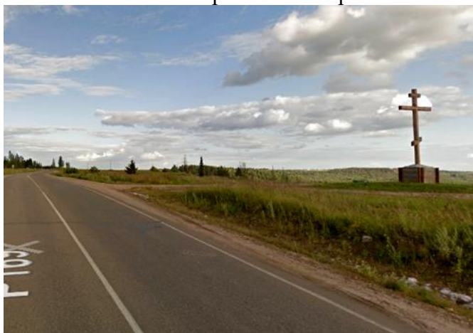
КП4 – Отрясовская Гора