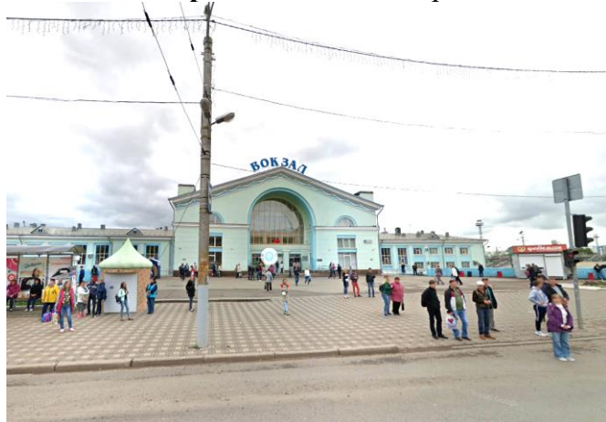
Старт - Ж/д вокзал, Киров