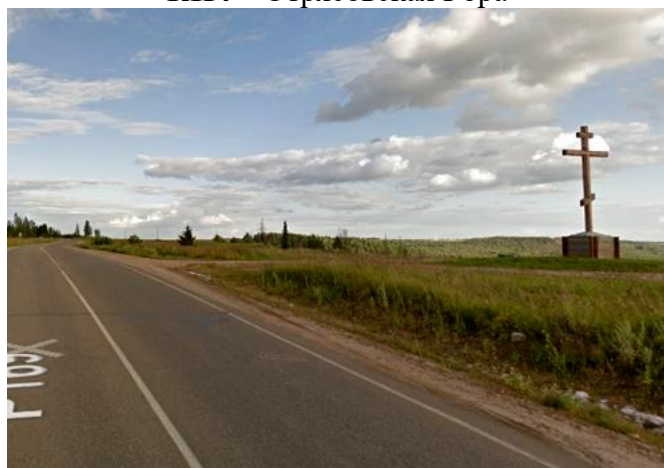
КП4 – Отрясовская Гора