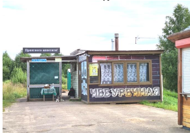
КП1 – Чебуречная