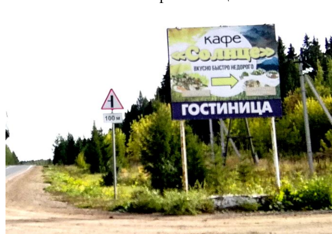
КП6 – кафе «Солнце»