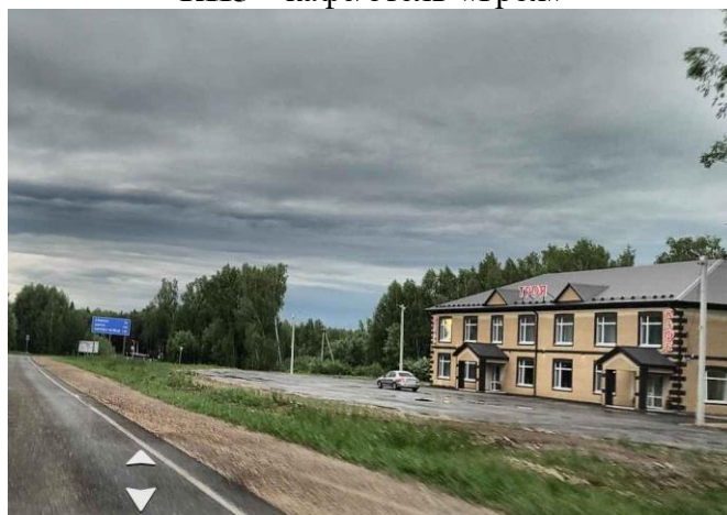
КП5 – кафе/отель «Троя»